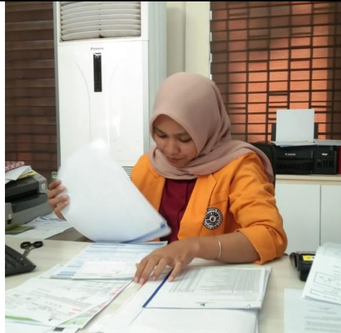
Gambar 1. Memisahkan dokumen nasabah yang akan di arsip