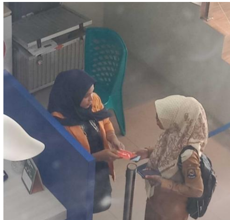
Gambar 3. Melayani nasabah