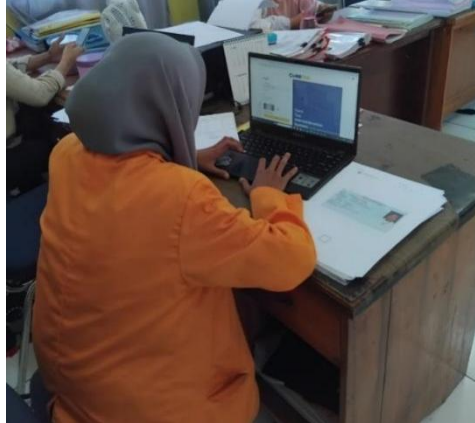
Gambar 1. Pelaporan Ebupot

Dalam pelaksanaan PKL, berbagai aktivitas dilakukan yang meliputi urusan administrasi dan urusan teknis, yaitu sebagai berikut: