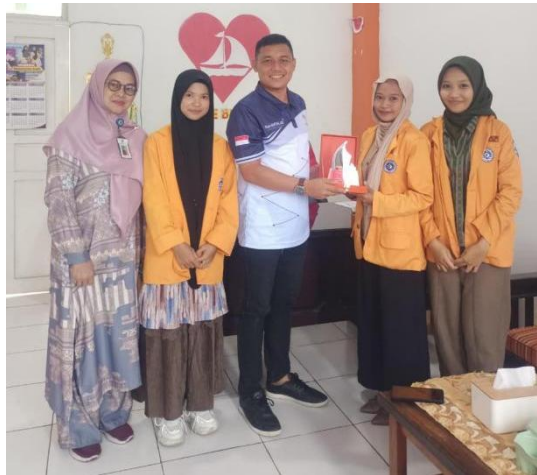
Gambar 8. Penyerahan Plakat

Kegiatan yang dilakukan oleh mahasiswa selama Program PKL memiliki kaitan erat dengan kompetensi mahasiswa yang mencakup soft skills dan hard skills. Soft skills meliputi kemampuan komunikasi efektif, kepemimpinan, berpikir kritis, kerja sama tim, manajemen waktu, kecerdasan emosional, kreativitas, serta kemampuan problem solving. Selama PKL, mahasiswa dilatih untuk menyampaikan informasi secara jelas kepada staf dinas, berkoordinasi dengan berbagai bagian, serta beradaptasi dengan budaya kerja birokrasi. Selain itu, mahasiswa juga belajar mengelola emosi, menjaga profesionalitas, dan menampilkan sikap kerja yang positif ketika menghadapi tekanan atau tugas mendesak.