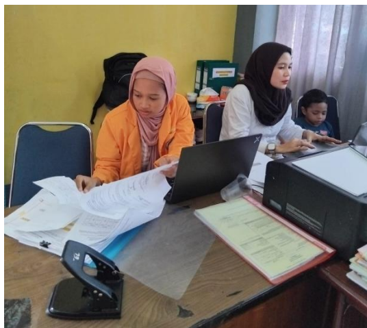
Gambar 3. Pengimputan NTPN, PPH dan membuat bukti potong PPH