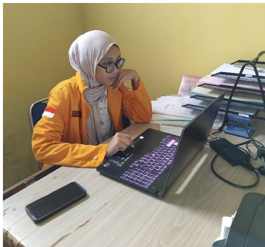
Gambar 6. Menginput data lembaga pendidikan ke dalam database program kerja