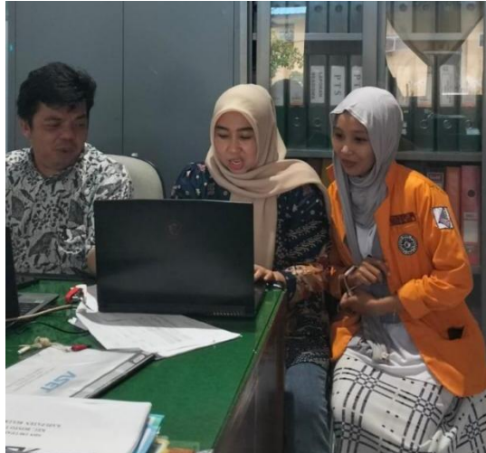
Gambar 7. Membuat draft surat undangan untuk kegiatan sosialisasi program