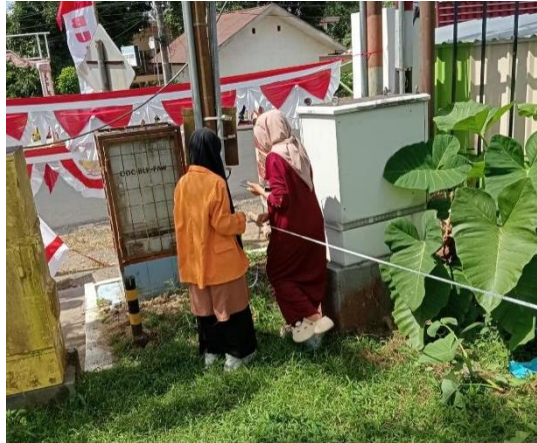
Gambar 4. Mengukur Aset Dikbud