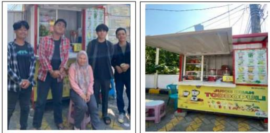
Gambar 1 dan 2 Kegiatan Kunjungan dan Perencanaan Kegiatan

Tujuan kegiatannya ialah merencanakan proyek serta mendiskusikan umkm apa yang akan menjadi objek pada proyek ini dan mencari serta wawancara pada UMKM yang akan menjadi tempat pelaksanaan proyek. Kegiatan yang kami lakukan yaitu yang pertama mendiskusikan UMKM apa yang ingin di pilih sebagai objek proyek. Lalu kita mencari UMKM yang ada disekitaran kita yang menjual JUS BUAH karena kami telah sepakat untuk memilih UMKM JUS, kami menemukan JUS BUAH TODOPULI lalu kami memesannya dan langsung mewawancarai pemilik UMKM tersebut. Kami juga meminta izin untuk menjadikan usaha tersebut sebagai objek kegiatan kami.